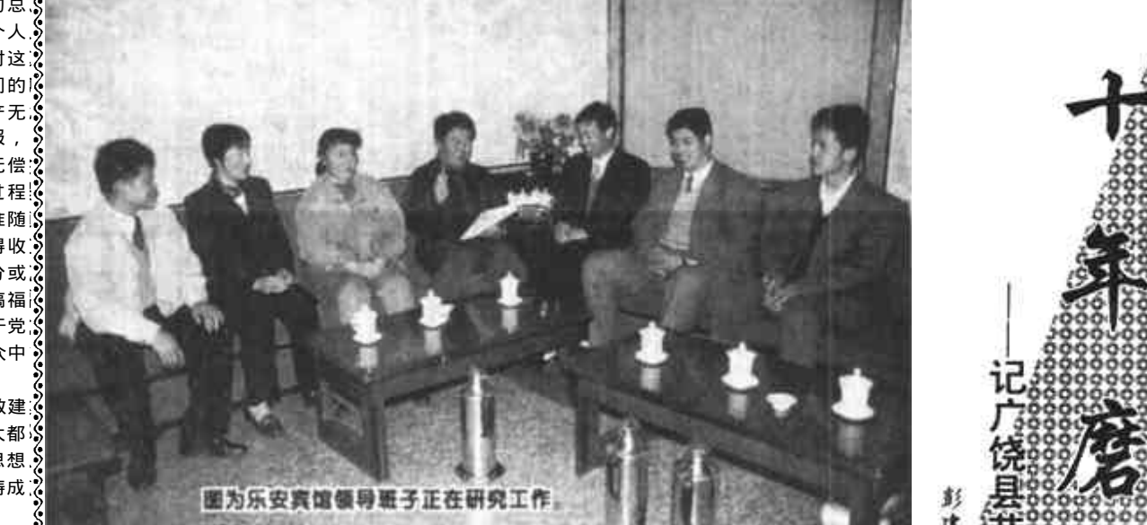
图为乐安宾馆领导班子正在研究工作

要使机关制度建设走上规范化,必须建立健全单位国有资产管理一系列的规章制度。一是建立健全国有资产登记使用制度。建立必要的资产卡、帐,及时准确地记录资产的增减、结存、分布情况,做到帐、物、卡一致。二是建立健全行政事业单位闲置资产调剂制度。对行政事业单位长期闲置和超编制定额的固定资产,按照《行政事业单位国有资产处置实施办法》及有关规定进行处置和调剂,防止国有资产浪费,提高其使用效益。三是建立健全非经营性资产转经营性资产管理。防止在资产过程中国有资产的流失。四是建立健全行政事业单位国有资产产管责任制,做到产权明晰、责权分明,堵住国有资产流失的各种渠道。五是探索实行行政事业单位国有资产行政领导负责制。对部门、单位主要领导进行离任前国有资产清查审计。这样可以增强部门、单位领导人的国有资产管理意识,提高其对国有资产管理重要性的认识。通过这些制度的建立,不仅可以加强行政事业单位国有资产管理,提高使用效益,而且对促进整个机关制度建设规范化有着重要意义。